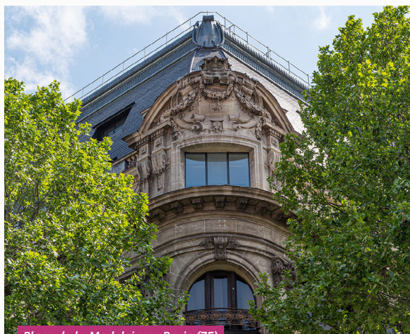
Place de la Madeleine - Paris (75)

Le premier trimestre 2023 a été marqué par la signature d'une promesse d'acquisition d'un immeuble de bureaux situé au 70 boulevard de Courcelles - Paris 17 ème (75). La réitération est prévue le 18 avril 2023.